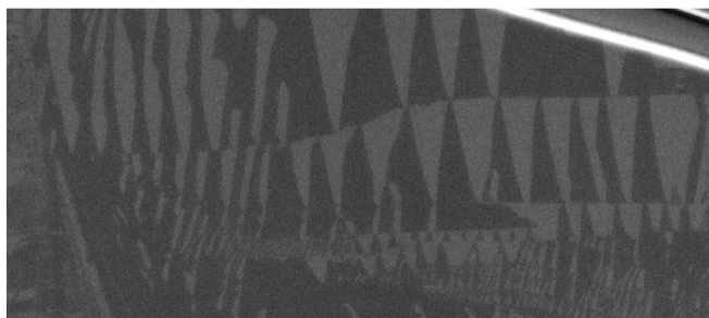
Projekt/Bc./Dipl. práce: Studium původu "butterfly loops" v magnetorezistenci u (\text{PbS})_{1,11}\text{VS}_2

K objevu došlo v rámci řešení Bc práce v r. 2022!