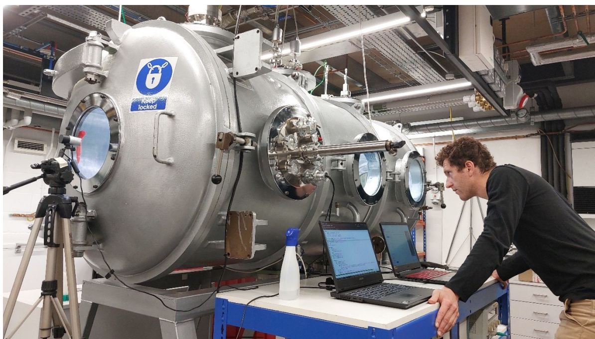
Obrázek 1: Experimentální zařízení (nahore) uvnitř vakuové komory George na Open University (dole), kde vědci napodobovali prostředí téměř bez atmosféry a sledovali, jaké útvary vznikají, když se voda vaří i zamrzá zároveň